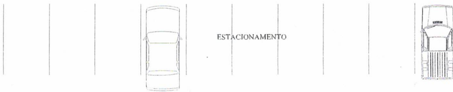
02 PLANTA BAIXA ESCALA: 1/100